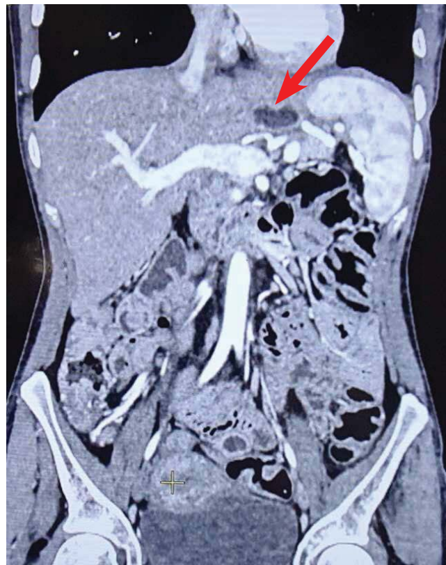
Рис. 3. Мультиспіральна комп'ютерна томографія органів черевної порожнини та малого таза з в/в контрастним підсиленням (стрілкою позначено зону езофагодуоденоанастомозу)

Враховуючи дані патоморфологічного дослідження, проведено імуногістохімічне дослідження видаленого шлунка з пухлиною (14.06.2021): СК AE1/AE3 (clone AE1/AE3, Dako) – позитивна цитоплазматична реакція в 90% пухлинних клітин і позитивна реакція в 95% епітелію інтактних залоз слизової оболонки шлунка. CDX-2 (Vitro Clone EP25) – позитивна реакція в 50% пухлинних клітин і негативна в епітелії інтактних залоз слизової оболонки. СК45 (Dako Clone GV809) – негативна реакція в пухлинних клітинах і позитивна мембранна реакція в нечисленних клітинах запального інфільтрату. Ki-67 (Vitro Clone SP6) – реакція позитивна в 40% пухлинних клітин та позитивна в 5% епітелію інтактних залоз. Висновок: морфологічна картина та результати проведеного імуногістохімічного дослідження свідчать на користь дифузної низькодиференційованої (G3) карциноми шлунка з високою проліферативною активністю (індекс проліферації Ki-67 – 40%).