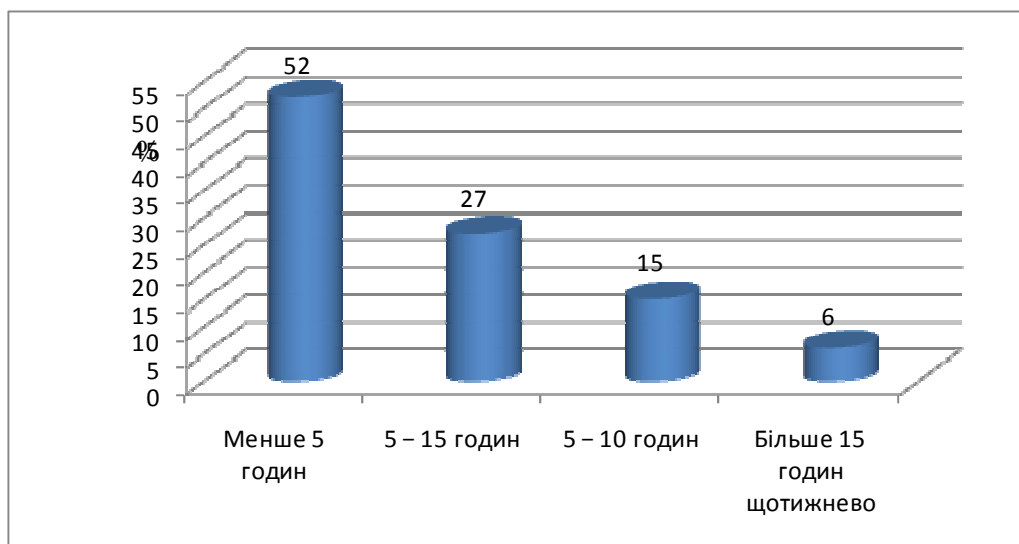
Рис. 2. Розподіл студентів за кількістю годин, проведених щотижнево в Інтернеті

Доступу до мережі Інтернет не має 6 % опитаних студентів. Діаграма (рис. 2) показує, скільки часу проводять студенти в Інтернеті.