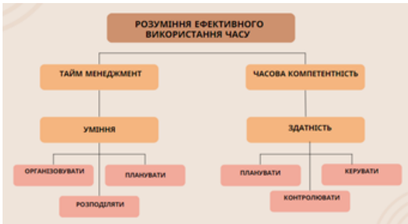
Рис. 1. Порівняння понять «тайм менеджмент» та «часова компетентність» (авторська схема)

В межах дослідження було здійснено аналіз та порівняння понять «тайм менеджмент» та «часова компетентність», встановлено, що вони є взаємозалежними (рис. 1). Тобто, обидва поняття сприяють формуванню такої характеристики особистості, як розуміння ефективного використання часу.