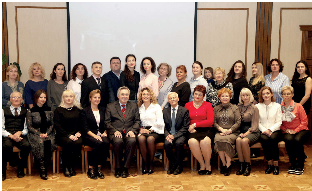
Колектив кафедри терапевтичної стоматології

Колектив кафедри велику увагу приділяє освоєнню нових технологій лікування зубів, захворювань пародонта та слизової оболонки порожнини рота. Проведено переобладнання окремих навчальних