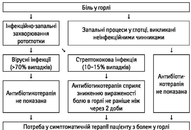
Рис. 1. Терапевтичний алгоритм при болю в горлі (Turner R. et al., 2018)

На сьогодні проведено окремі дослідження щодо вивчення анальгезивної властивості флурбіпрофену. Доведено, що обидва енантіомери його молекули однаково зменшують більзалежні хемосенсорні потенціали у людини (Lötsch J. et al., 1995). Це дослідження підтвердило припущення щодо розмежування між протизапальним та анальгезивним ефектом у різних НПЗП. Тобто не завжди при гарному протизапальному ефекті наявні виражені анальгезивні властивості. Так, показано, що флурбіпрофен купірує біль не лише завдяки дії на ноцицептивні рецептори з блокуванням больових потенціалів, а й за рахунок зменшення впливу запальних біологічно активних речовин (гістамін, брадікінін та ін.) та змен-