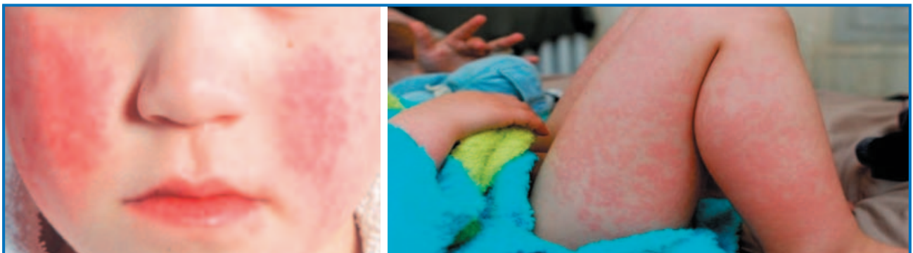
Рисунок 2. Инфекционная эритема на щеках — синдром «отшлепанных щек» и эритематозная пятнисто-папулезная сыпь на конечностях

У взрослых патогномичный «синдром пощечины» часто отсутствует. К другим дерматологическим синдромам, связанным с парвовирусной инфекцией, относят синдром пятнисто-папулезной сыпи в виде «перчаток и носков» , который встречается чаще всего у подростков и взрослых. Обычно при данной форме заболевания за несколько дней до высыпаний могут возникнуть умеренно выраженные симптомы интоксикации. У некоторых больных температура достигает 39–40 °С, однако, несмотря на высоту лихорадки, общее состояние страдает мало. Клинически синдром «перчаток и носков» проявляется симметричной эритемой с четко выраженной локализацией в области запястных суставов и лодыжек, внешним видом напоминающей перчатки и носки (рис. 3). Быстро распространяющиеся пятнисто-папулезные высыпания, в ряде случаев с геморрагическим компонентом, сопровождаются