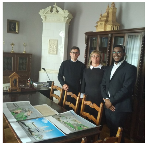
Мал. 3 Зі студентами Мукачівської греко-католицької єпархії м. Ужгорода на День відкритих дверей у єпископській резиденції.