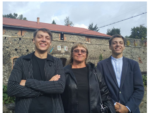
Мал.2. Зі студентами медичного факультету Ужгородського національного університету.