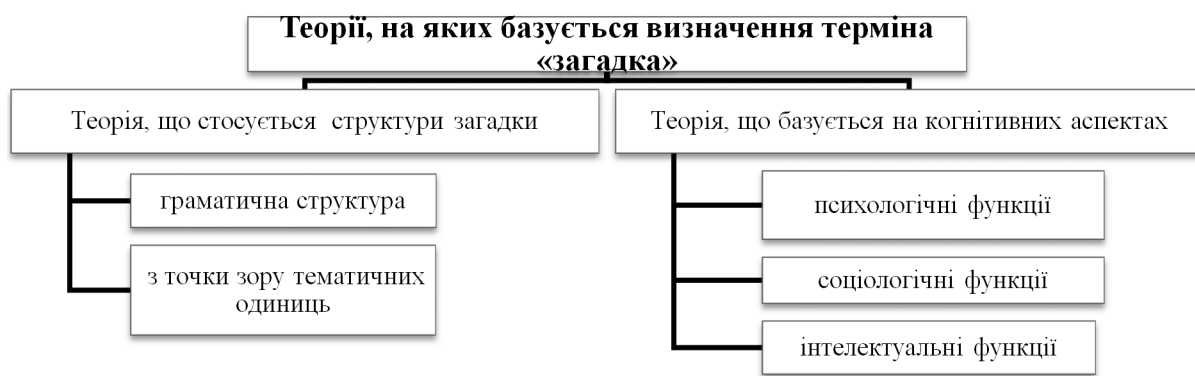
Рис. 1. Теорії, на яких базується визначення терміна «загадка» (складено автором на основі [7]).

Як зазначають Т.А. Green та W.J. Pepicello, визначення загадки базується, в основному, на двох теоріях (рис. 1).