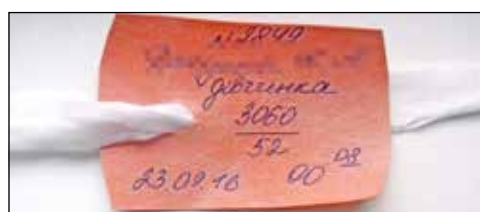
Рис. 3. Щасливе завершення вагітності

Європейської протиревматичної ліги (EULAR) для прийняття рішень щодо застосування протиревматичних препаратів перед вагітністю, під час вагітності та лактації (S. C. Gotestam et al., 2016) було відмінено метотрексат; прийом ГК (преднізолон у дозі 45 мг/добу з поступовим зменшенням дози до 5 мг від III триместра вагітності) та інфліксимабу продовжено. Ультразвуковий скринінг плода впродовж усіх трьох триместрів – без патологічних змін. Хвора Д. народила здорову доношену дитину (рис. 3), годувала грудним молоком. Повторних загострень захворювання не було. Поступово покращилася координація, повністю зник шум у правому вусі та знизився рівень шуму в лівому, а також покращився слух на праве вухо. Наразі хвора отримує монотерапію інфліксимабом у підтримувальному режимі, скарг не має, активно працює, відхилення у стані здоров'я та розвитку дитини відсутні.