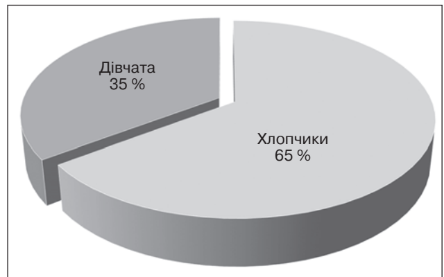
Рисунок 2. Розподіл дітей, хворих на сальмонельоз, за статтю