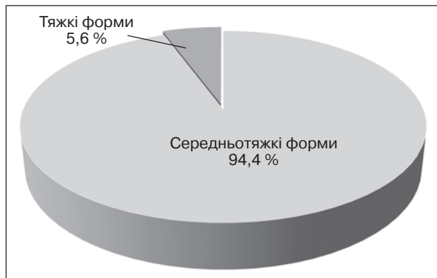
Рисунок 3. Розподіл дітей за ступенем тяжкості сальмонельозу

В етіологічній структурі захворювання переважала Salmonella enteritidis (90 хворих, 82,5 %), у тому числі Salmonella enteritidis у комбінації з вірусною діареєю — 5 (4,6 %) хворих.