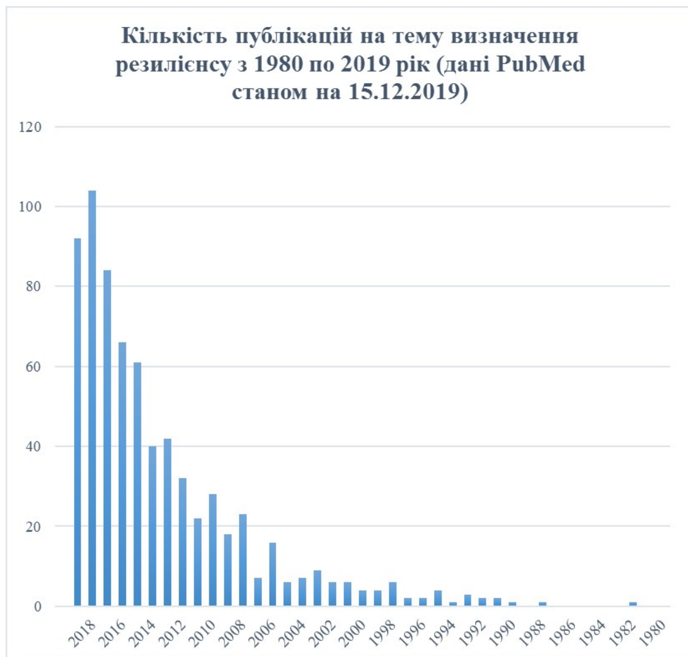
Рисунок 2. Кількість публікацій на тему визначення резилієнсу з 1980 по 2019 рік (пошук за ключовими словами «resilience definition» у PubMed станом на 15 грудня 2019)

однозначне визначення резилієнсу необхідне для того, щоб різні дослідники, вивчаючи цей феномен в різних галузях медицини та психології, були впевнені, що вивчають одне й те ж явище, для уникнення розбіжностей в операціоналізації та можливості порівняння між собою результатів досліджень для отримання надійних висновків.