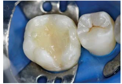
Рис. 10. Пломбирование полости материалом «Jen-Radiance Molar».