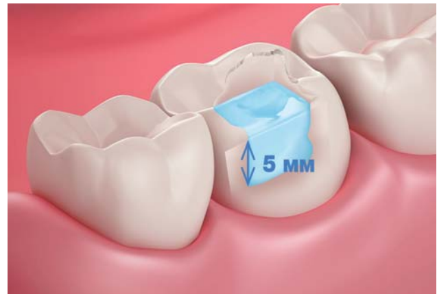
Рис. 2. Заполнение объема утраченного дентина порциями толщиной до 5 мм.

представила высоконаполненный композит для жевательной группы зубов – Jen-Radiance Molar (рис. 1). Этот макрофильный композит характеризуется значительной степенью наполнения материала неорганическим бимодальным наполнителем – до 82 % по весу при среднем размере частиц бимодального наполнителя: основная рентгеноконтрастная фаза – до 8 мкм; нанопополнителя – 10–30 нм (нанометров). При этом за счет более плотного распределения наполнителя (между крупными частичками основного наполнителя не только смола, но и наночастички наполнителя) увеличено процентное соотношение наполнителя и сведено к минимуму количество смолы.