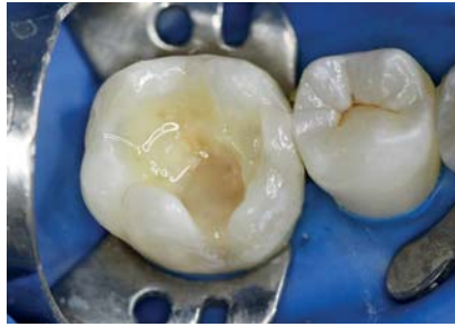
Рис. 9. Нанесение жидкого фотополимерного материала «Jen LC-Flow» цвета А2 в месте перехода эмали в пломбировочный материал.