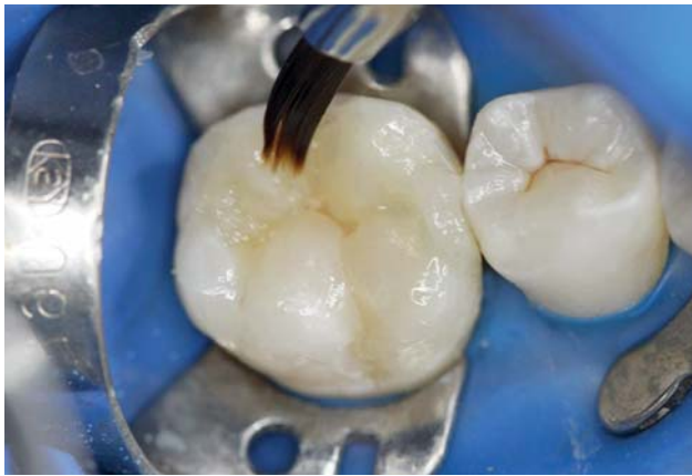
Рис. 11. Окончательная реставрация с использованием фотополимерного реставрационного материала «Jen-Radiance».