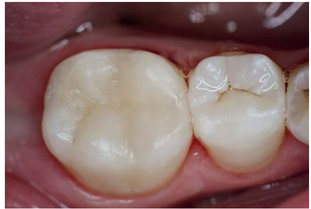
Рис. 12. Окончательный вид реставрации зуба 46.

материала дно и вся полость зуба послойно (двумя слоями по 3 мм) были запломбированы материалом «Jen-Radiance Molar» (рис. 10).