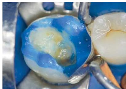
Рис. 6. Протравливание эмали и дентина ортофосфорной кислотой «Phospho-Jen AS».