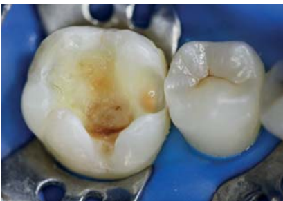
Рис. 5. Раскрытие кариозной полости зуба 46.

Далее для придания пластичности будущей реставрации и предупреждения усадки пломбировочного