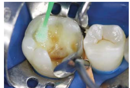
Рис. 7. Нанесение адгезивной системы «Jen-Unibond».