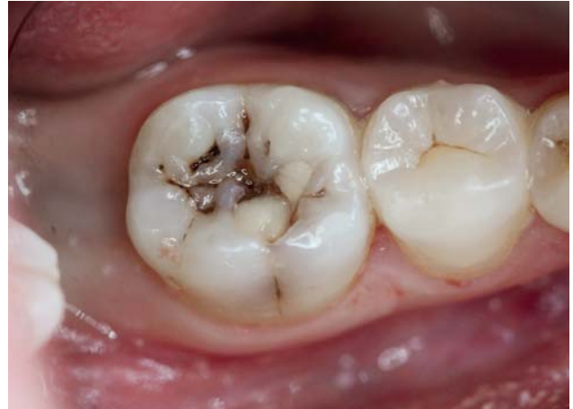
Рис. 4. Хронический средний кариес зуба 46.

План лечения зуба 46 – оперативное лечение (препарирование) с последующим пломбированием, используя материалы «Jen-Radiance Molar» и «Jen-Radiance».