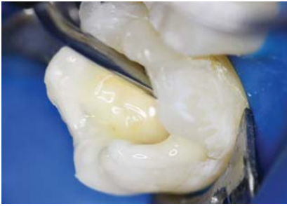
Рис. 8. Нанесение жидкого фотополимерного материала «Jen LC-Flow» цвета А2 на дно полости.