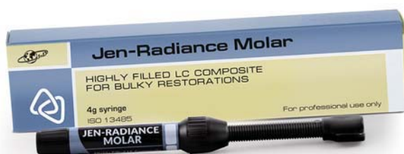
Рис. 1. Высоконаполненный композит для жевательной группы зубов «Jen-Radiance Molar».