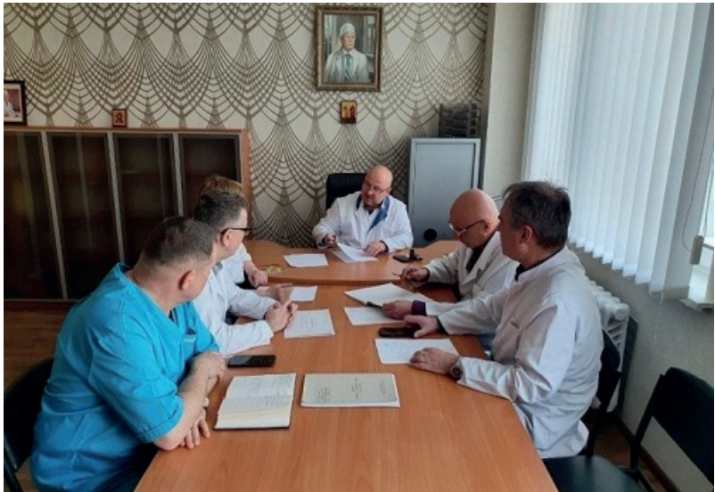
Виробнича нарада співробітників кафедри хірургії № 3 НМУ імені О.О. Богомольця