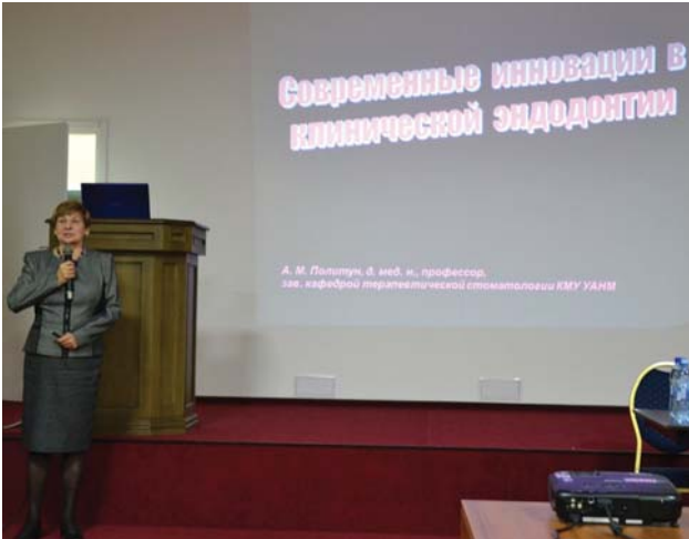
Фото 10. Президент Української ендодонтичної асоціації професор А.М. Політун читає лекцію «Інновації в клінічній ендодонтії».

За видатні заслуги в галузі підготовки стоматологічних кадрів, післядипломної освіти, багаторічну професійну діяльність і впровадження у практику стоматології новітніх досягнень науки й технологій професор А.М. Політун нагороджена медаллю «Ветеран праці» та професійними відзнаками: орденом «Золотий стаміл»