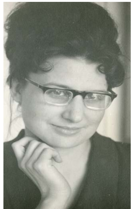
Фото 4. Кандидат медичних наук, асистент (1968 р.).