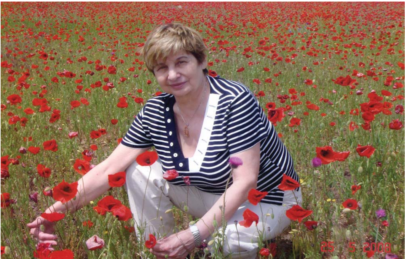
Фото 12. Нам треба жити для добра.