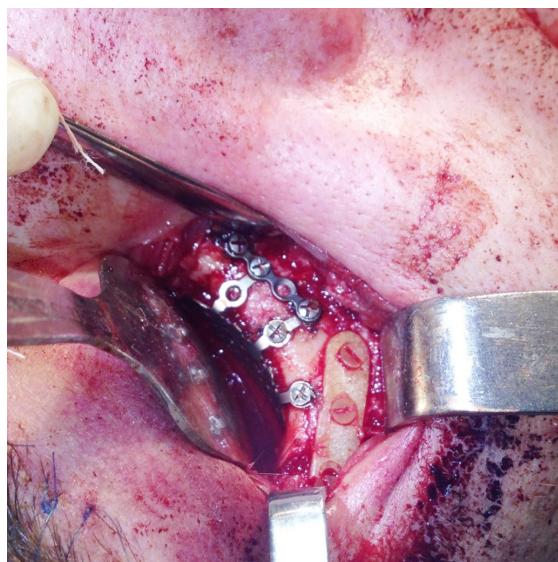
Рис. 1. Хворий П., 28 років. Діагноз: травматичний перелом правої виличної кістки, поєднаний із дефектом дна правої орбіти. Етап операції - полімеростеосинтез у ділянці тіла виличної кістки поблизу нижньо-орбітального краю

У 11 (91,7 %) пацієнтів основної групи з переломами та деформаціями НЩ отримано задовільний результат хірургічного лікування, що клінічно і рентгенологічно підтверджено через 1 міс після операції. Ускладнень запального характеру в післяопераційному періоді не спостерігали. Консолідація з'єднаних кісткових фрагментів відбувалася вчасно. В 1 (8,3 %) пацієнта з незрошеним переломом у ділянці підборіддя в умовах нефіксованого прикусу (без іммобілізації НЩ) полімеростеосинтез двома ЕПУ-ГАП-ЛЕВ-пластинами й гвинтами був неефективним. У післяопераційному періоді відбулося зміщення фрагментів на 4 мм по висоті, що пов'язано з невідповідністю параметрів фіксатора умовам функціонального навантаження (рис. 1, 2).