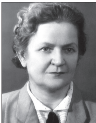
Професор Олена Сидорівна Кошель-Плескунова

Міністерства охорони здоров'я у Демократичній Республіці В'єтнам, де проводила велику консультативну роботу з організації педіатричної служби та підвищення кваліфікації лікарів і фельдшерів в області педіатрії. Автор понад 100 наукових праць, присвячених фізіології і патології травлення у дітей раннього віку, клініці та лікуванню туберкульозного менінгіту, дослідженню вищої нервової діяльності у дітей.