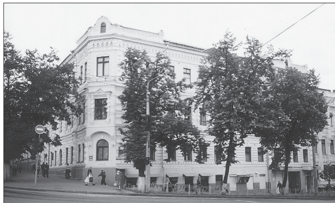
Дитяча клінічна лікарня №6

ного гемодіалізу на 6 діалітичних місць (наказ N267 ГУОЗ м. Києва від 2.09.98), в якому проведено понад 50 000 сеансів гемодіалізу. З 1999 року відкрите нефрологічне відділення на 20 ліжок (наказ N308 ГУОЗ м. Києва від 1.09.99), що дозволило покращити надання медичної допомоги дітям з вказаною патологією. Крім того, як вже відзначалось, з 1990 року на клінічній базі кафедри створений і успішно функціонує Центр діагностики та лікування вегетативних дисфункцій у дітей (наказ №245 ГУОЗ м. Києва від 29.06.90), а з 1991 року - спільний франко-український консультативно-діагностичний центр "Діти Чорнобиля", який надає допомогу дітям, що потерпіли від аварії на Чорнобильській АЕС. За період існування центру обстежено та взято на облік понад 30 000 осіб, які постраждали внаслідок аварії на ЧАЕС. Відповідно до наказу ГУОЗ та МЗ м. Києва з 2 січня 2003 року відкрите міське дитяче ендокринологічне відділення на 30 ліжок (наказ ГУОЗ та МЗ за №522 від 2.12.02). За короткий період його роботи вдалося налагодити всі методики, які необхідні для ефективного роботи відділення.