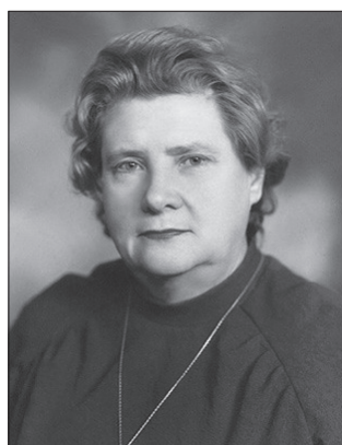
Професор Чеботарьова Віра Дмитрівна

нетичну роль судинної проникності і порушення мікроциркуляції при ревматизмі, що дозволило удосконалити терапію захворювання. В 1965 році професор В.Д. Чеботарьова представила блискучу роботу на IX Міжнародному конгресі педіатрів (Японія), присвячену новим аспектам патогенезу ревматизму. Її обирають почесним членом Європейського товариства з вивчення мікроциркуляції. В.Д. Чеботарьова була прекрасним педагогом і методистом. Велику увагу вона приділяла удосконаленню педагогічного процесу, підготовці викладачів і наукових працівників. Під її керівництвом були видані навчальні посібники з пропедевтики дитячих хвороб для студентів, які користуються великою популярністю. Віра Дмитрівна була чудовим лектором, здатним просто і доступно висвітлювати складні питання клінічної педіатрії.