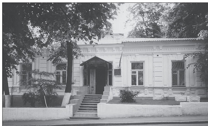
Перша клінічна база кафедри – дитяча лікарня Шевченківського району (вул. Обсерваторна, 8)

Клінічною базою кафедри у 1946-47 навчальному році була дитяча терапевтична клініка на 90 ліжок Інституту охорони материнства і дитинства (50 ліжок для дітей раннього віку і 40 ліжок для дітей старшого віку), яка була також базою для кафедри педіатрії Київського інституту удосконалення лікарів. Це створювало певні труднощі в організації навчального процесу. Крім того, для практичних занять студентів використовувались відділення для новонароджених, дитяча консультація, молочна кухня, ясла №4 та Будинок дитини №1.