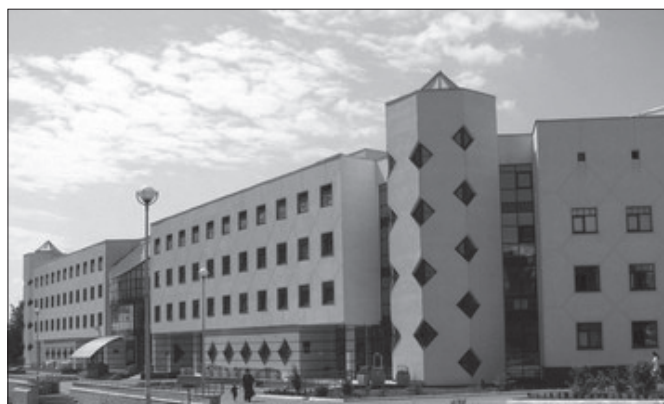
Дитяча клінічна лікарня №7