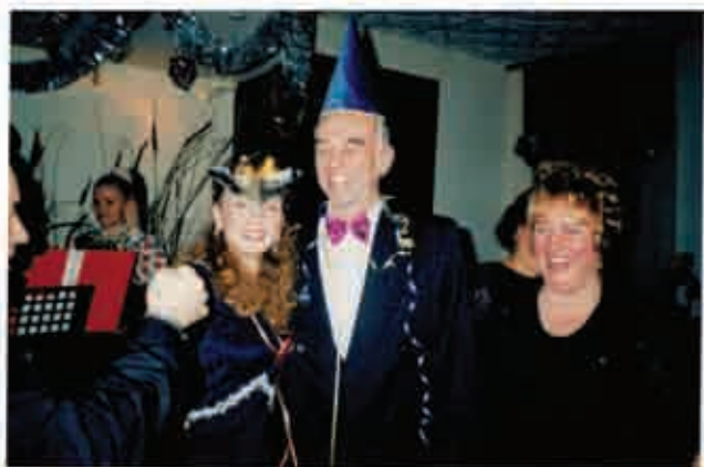
Святкування Нового року з колегами кафедри