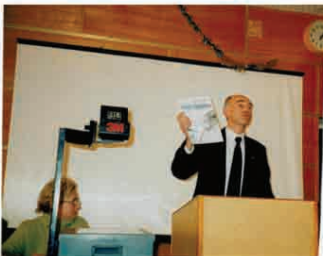
Презентація журналу «Світ ортодонції»