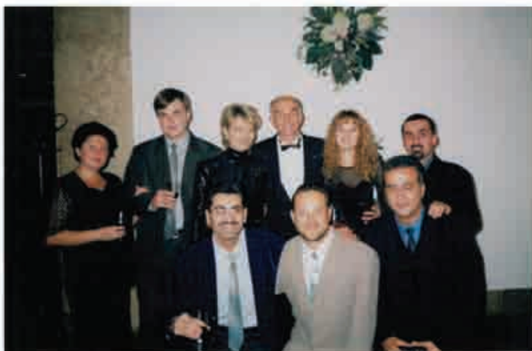
Перша міжнародна конференція «Актуальні проблеми ортодонції»