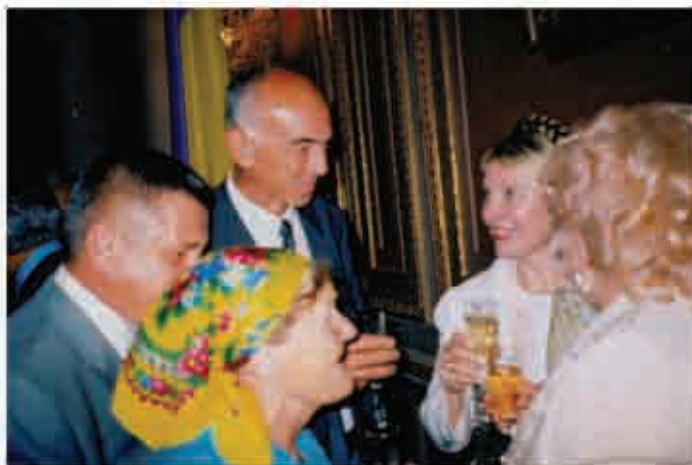
З Юлією Тимошенко