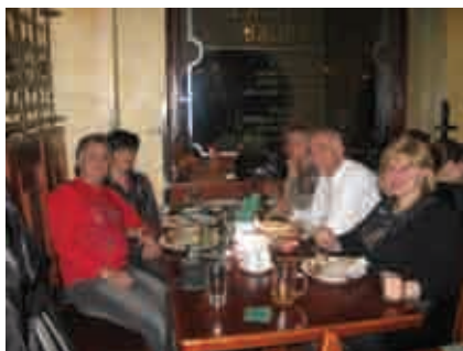
Прага. V Симпозиум ЕвроАзиатской ассоциации ортодонтов

Он всегда поддерживает дружеские контакты с ассоциациями ортодонтов разных стран.