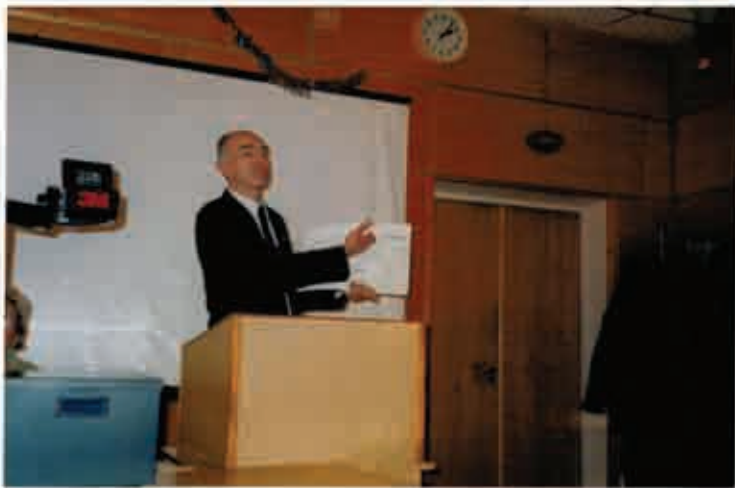
Презентація журналу «Світ ортодонції»