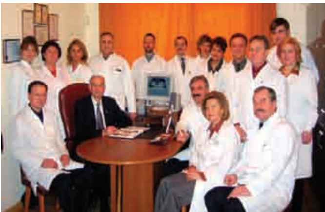
Засідання кафедри оргодонтії. 1990 р.