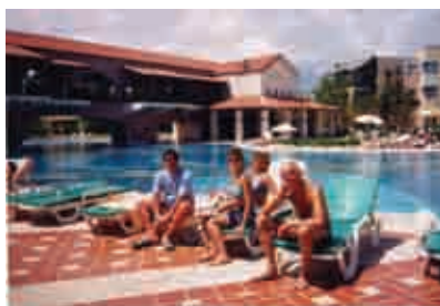
В перерывах между учебой