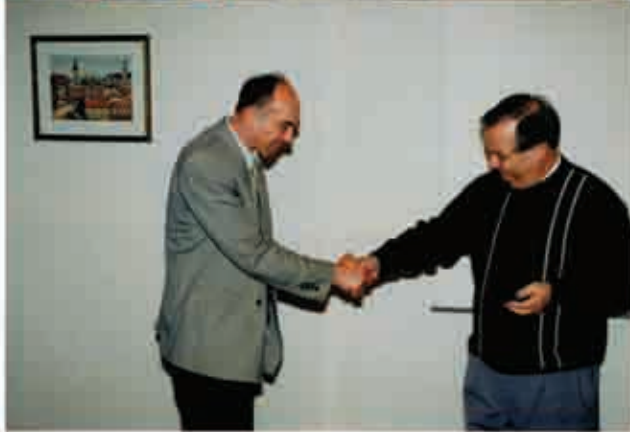
Консультації з колегами