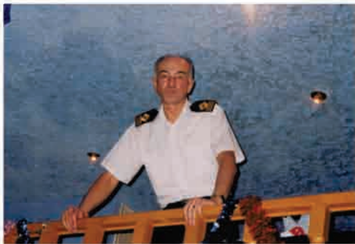
Служба на флоті