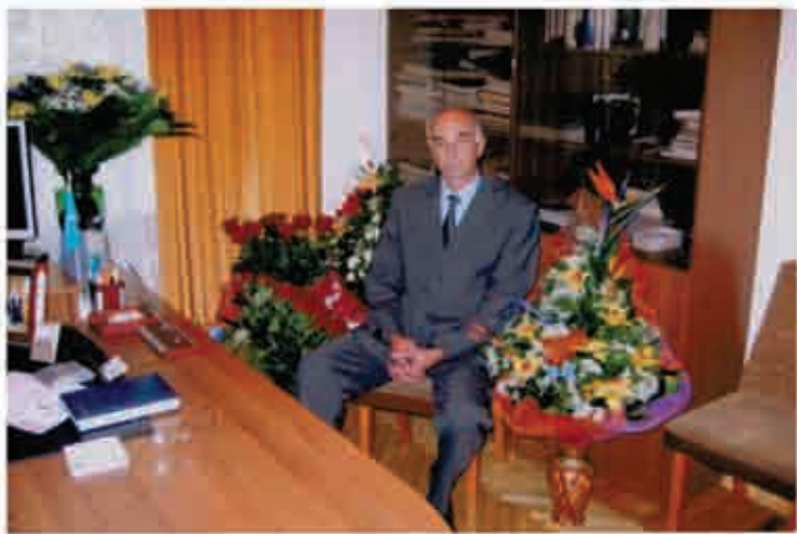
Ювілейний день народження. 50 років