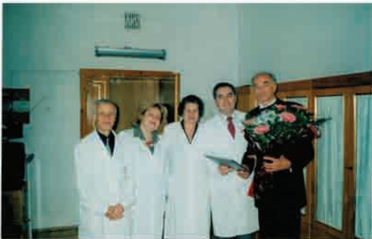
Ювілейний день народження. 50 років