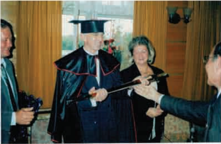
Ювілейний день народження. 50 років