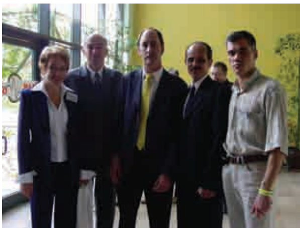
Участники 1-го Международного симпозиума Discoveri в Турции

Симпозиумы очень полюбили ортодонты, ведь специалисты из разных стран имели на них возможность не только пообщаться с коллегами, поделиться опытом, но и отдохнуть на побережье в свободное от учебы время.