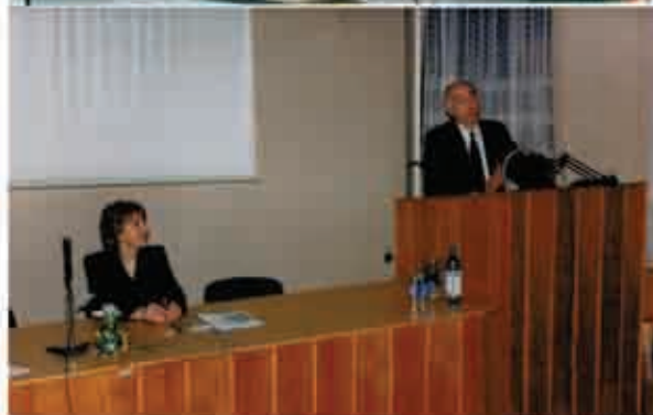
Виступи на конференціях