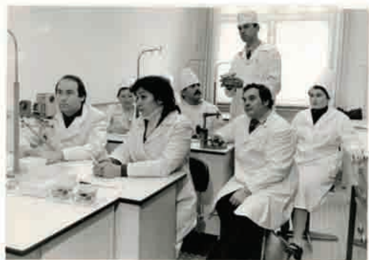
Професор Фліс П. С. проводить заняття з викладачами інших ЗВО