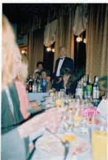
Ювілейний день народження. 50 років