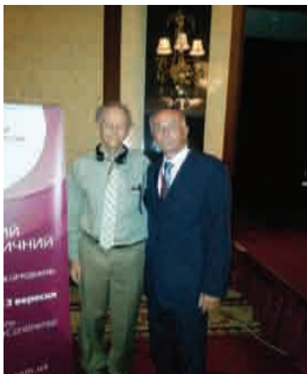
З президентом Всесвітньої асоціації ортодонтів