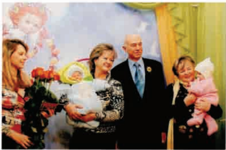
Народження першого внука