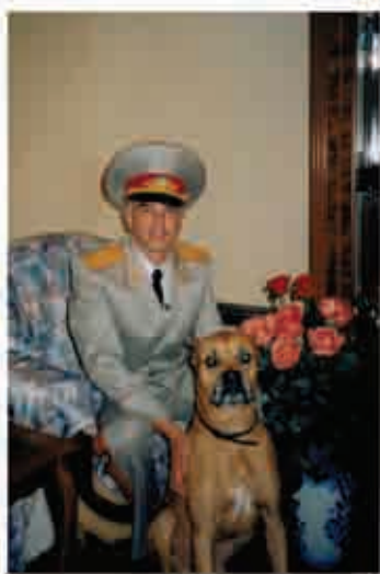
З домашнім улюбленцем