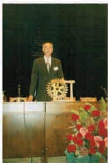
Виступ на засіданні Rotary International