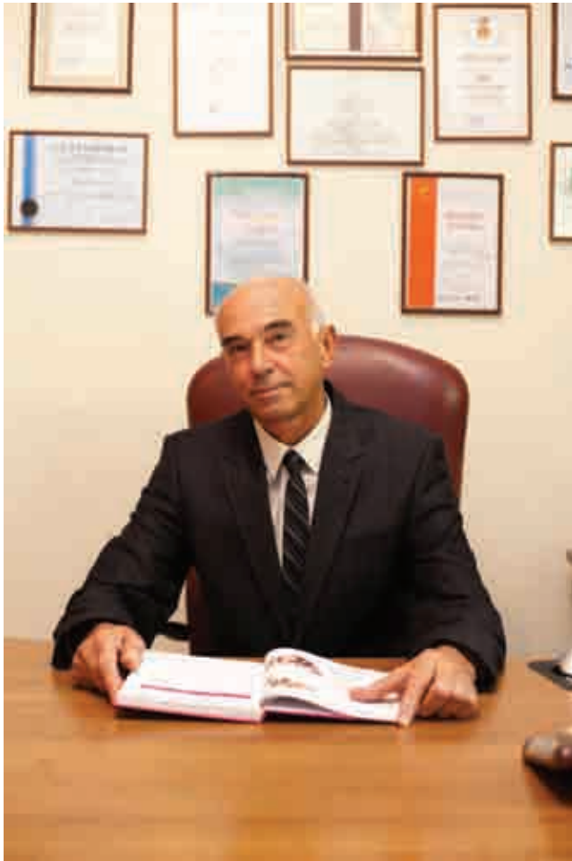
Фліс Петро Семенович – лікар-стоматолог, ортопед і ортодонт, доктор медичних наук, професор, завідувач кафедри ортодонції та пропедевтики ортопедичної стоматології НМУ імені О. О. Богомольця, заслужений діяч науки і техніки України