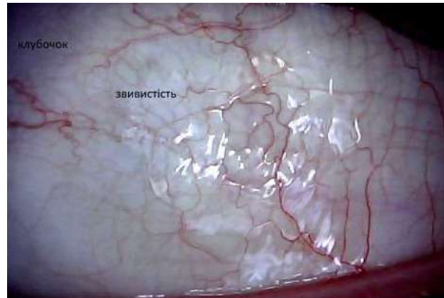
Рис.2 Біомікроскопічна картина хворого, 10 років з ЦД 1 типу із тривалістю хвороби 2 роки, 3 ступінь ПМЦ

Так, артеріоло-венулярний коефіцієнт 1:3, 1:4 корелює із звуженням капілярних браншів нігтьового ложа ( r=0,328 , p<0,05 ), множинна нерівномірність калібру судин кон'юнктиви має достовірний зв'язок із безсудинними ділянками «лисини» ( r=0,327 , p<0,05 ). Досто-