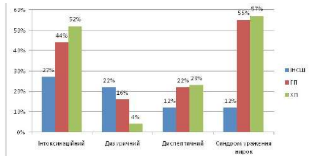
Рис. №2 Частота виявлення основних синдромів при інфекції сечових шляхів.

При всіх формах інфекції сечових шляхів спостерігалось переважання інтоксикаційного синдрому серед скарг хворих. Звертає увагу поширеність диспептичного синдрому при гострому та рецидивуючому пієлонефриті. (див. рис. №2).