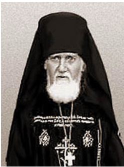
Схиархимандрит Серафим (Соболев)