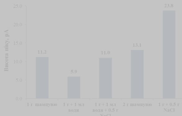
Рисунок 4. Залежність висоти хроматографічного піка від способу приготування зразка.

було виявлено найбільший відгук порівняно зі зразком без добавки. Спостерігається збільшення сигналу вдвічі.