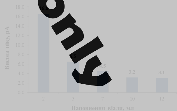
Рисунок 2. Залежність висоти хроматографічного піка від наповнення віали при 80°C.

Фазове співвідношення ( \beta )—відношення об'єму парової фази до об'єму зразка у віалі для підготовки проби. Зазвичай зменшення фазового співвідношення збільшує відгук для летких речовин і мало впливає на відгук малолетких речовин. За рахунок здатності до утворення водневих зв'язків з водою діоксан вважається малолеткою речовиною. Вибір оптимального співвідношення парової та рідинної фази може істотно впливати на відгук речовини. Тому було досліджено вплив фазового співвідношення на відгук 1,4-діоксану в діапазоні температур від 80°C до 100°C. Порівнюючи отримані дані щодо висоти піків, рисунок 2, було встановлено, що при збільшенні об'єму наповнення віали висота хроматографічного піка знижується. Для проведення наступних досліджень обрали об'єм наповнення віали 2 мл як такий, за якого спостерігались найбільш високі показники площі та висоти піку.