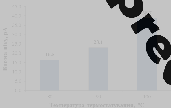
Рисунок 3. Залежність висоти хроматографічного піка від температури при діленні потоку 1:5.

утворення водневих зв'язків. Тому температура термостатування може істотно впливати на розподіл діоксану між рідкою і паровою фазою. Збільшення кількості діоксану в паровій фазі має на меті покращити характеристики методики щодо виявлення невеликих кількостей речовини. Оскільки підвищення температури послаблює водневі зв'язки, які діоксан може утворювати з водною фазою, доцільно перевірити залежність величини аналітичного відгук від температури термостатування. Аналітичний відгук реєстрували за температури кипіння: 80 °С, 90 °С і 100 °С при обраному поділі потоку 1:5 та при наповненні віали 2 мл (рис. 3). Очевидно, що підвищення температури підвищує відгук діоксану. З огляду на те, що в шампуні міститься вода, яка має температуру кипіння 100 °С, для подальшого ретинного аналізу було обрано температуру кипіння 95 °С, задля зниження ризику пошкодження флакона при термостатуванні.