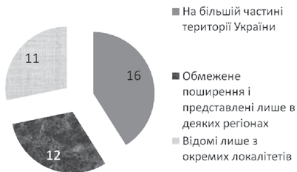
Рис. 3. Поширення лікарських папоротеподібних в Україні (кількість видів)

зростають у різних регіонах України, але більшість з них трапляються спорадично чи зростають розсіяно. Значна частина папоротей (30,77 %) мають обмежене поширення і представлені лише в деяких регіонах (Полісся, Карпати, Лісостепова зона тощо) або відомі лише з окремих локалітетів (28,21 %) (рис. 3). Серед останніх переважають раритетні види папоротей, занесені до Червоної книги України. Їх популяції переважно малочисельні, часто представлені поодинокими спорофітами чи їх невеликими агрегаціями.