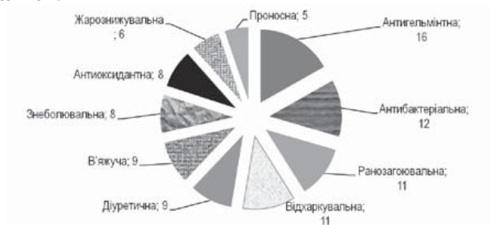
Рис. 2. Основні лікувальні властивості папоротеподібних. Цифрою позначено кількість видів

Аналіз даних про вміст біологічно активних сполук досліджуваних видів та їхню дію, виявлених в аналізованих папоротей, свідчить про широкий спектр їх властивостей. Так, понад 80 % папоротей характеризуються протизапальними, діуретичними, лактогенними, антигельмінтними, сечогінними, відхаркувальними, знеболювальними, антиоксидантними та іншими лікувальними властивостями (рис. 2). Для більшості аналізованих папоротей (64,1 %) виявили протизапальний вплив на шлунок і кишечник, артеріальний тиск, а також як в'яжучий або легкий проносний засіб. Найбільш відомі серед них – Onoclea struthiopteris , Polypodium vulgare L., Pteridium aquilinum та деякі інші. Що стосується захворювань дихальної системи (у тому числі як відхаркувальний та протизапальний засіб), то відомо, що 45 % папоротей застосовують для лікування респіраторних проблем. Фармакологічні властивості або лікарське застосування шести видів ( Asplenium fontanum (L.) Bernh., Azolla caroliniana Willd., Cheilanthes acrosticha (Balb.) Tod., Dryopteris caucasica (A. Braun) Fraser-Jenk. & Corley, Dryopteris villarii (Bellardi) Woyne. ex Schinz & Thell., Oreopteris limbosperma (Bellardi & All.) Holub та Pilularia globulifera L.) невизначені, проте основні біологічно активні речовини досліджувалися.