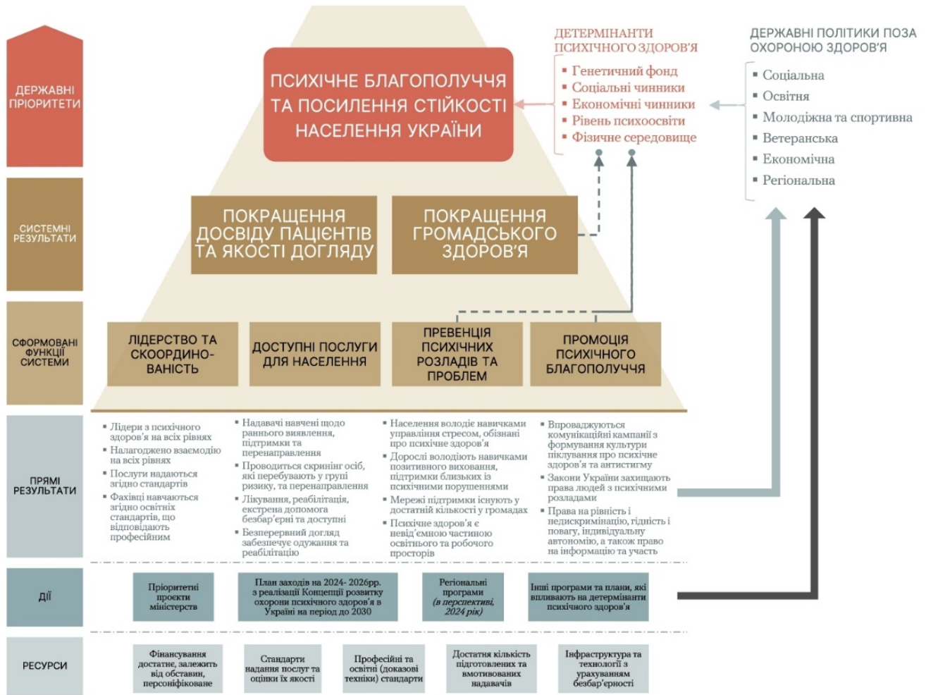
Рисунок 1. Цільова модель «Система у сфері психічного здоров'я та психосоціальної підтримки»

Цільова модель пропонує сформуванню чотири ключові завдання для досягнення мети (рис. 1).