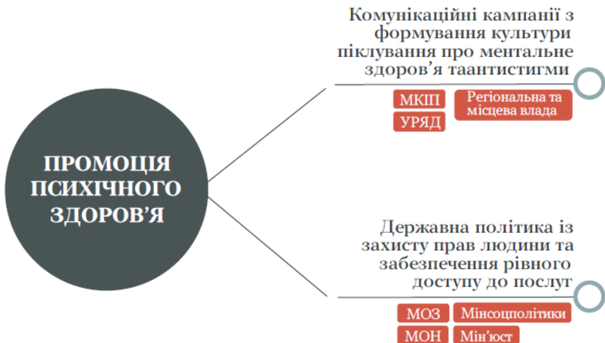
Рисунок 5. Промоція психічного здоров'я.

4. Промоція психічного здоров'я – це загальнонаціональна комунікаційна кампанія для всього населення, для дітей та дорослих – створення безпечного середовища під час здобуття освіти, праці, життя у громаді (рис. 5).