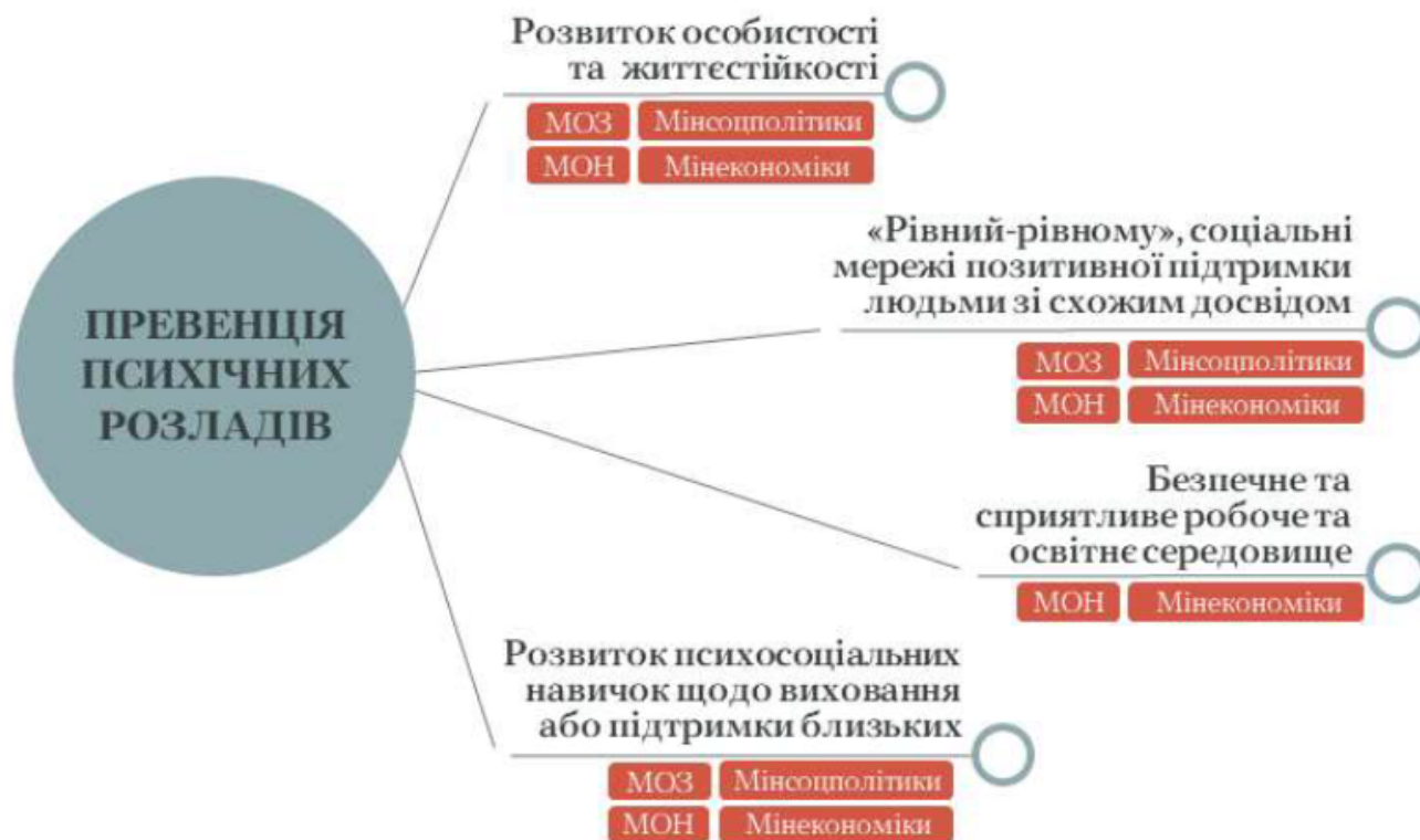
Рисунок 4. Превенція психічних розладів.

Превенція у сфері психічного здоров'я (психопрофілактика) передбачає вжиття заходів для зміцнення психічного здоров'я та запобігання розвитку психічних розладів. Заходи з профілактики є критично важливою частиною вискоелективної системи психічного здоров'я. Превенція психічних розладів є складною та багатогранною діяльністю, яка включає стратегії на рівні особи, сім'ї, громади та суспільства. Разом з тим, неможливо запобігти розвитку абсолютно всіх психічних розладів, превенція може як пом'якшити вплив факторів ризику розвитку розладів, так і посилити захисні превентивні фактори.