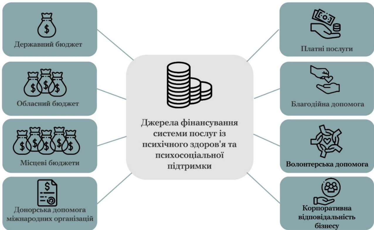
Рисунок 6. Джерела фінансування послуг ПЗПСП.

Включення фінансування послуг до державного та місцевих бюджетів є значним кроком у визначенні пріоритету психічного здоров'я як частини загальної системи охорони здоров'я. Водночас послуги можуть фінансуватися коштом підприємств, установ та організацій, благодійної допомоги, коштом отримувачів послуг та з інших джерел, не заборонених законодавством.