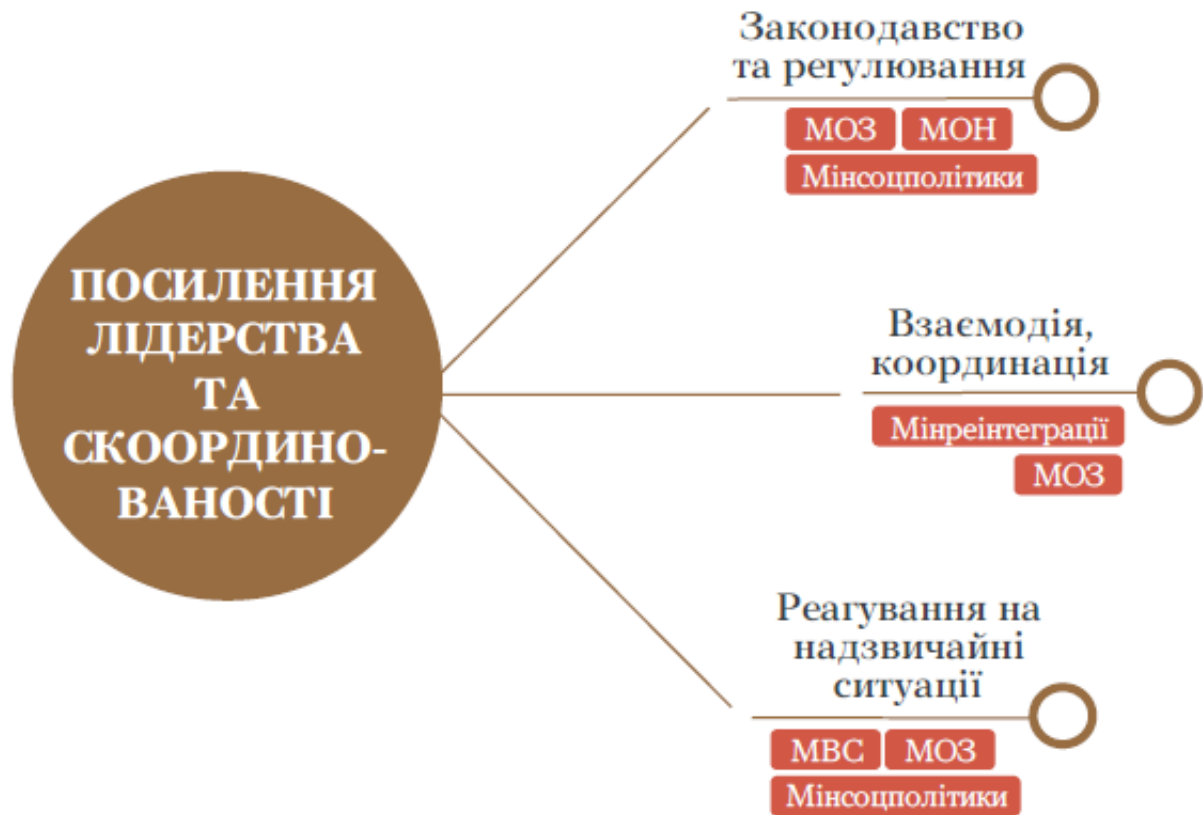
Рисунок 2. Посилення лідерства та скоординованості.

Це завдання передбачає, що найбільш експертні у сфері психічного здоров'я центральні органи виконавчої влади - МОЗ, МОН, Мінсоцполітики та Мінреінтеграції, МВС (у випадку реагування у надзвичайних ситуаціях), - як міністерства-лідери і координатори, створюють правове поле для системи у сфері ПЗПСП, до якого залучають всі інші міністерства. Окреме законодавство створює правову базу для послуг з психічного здоров'я та психосоціальної підтримки.