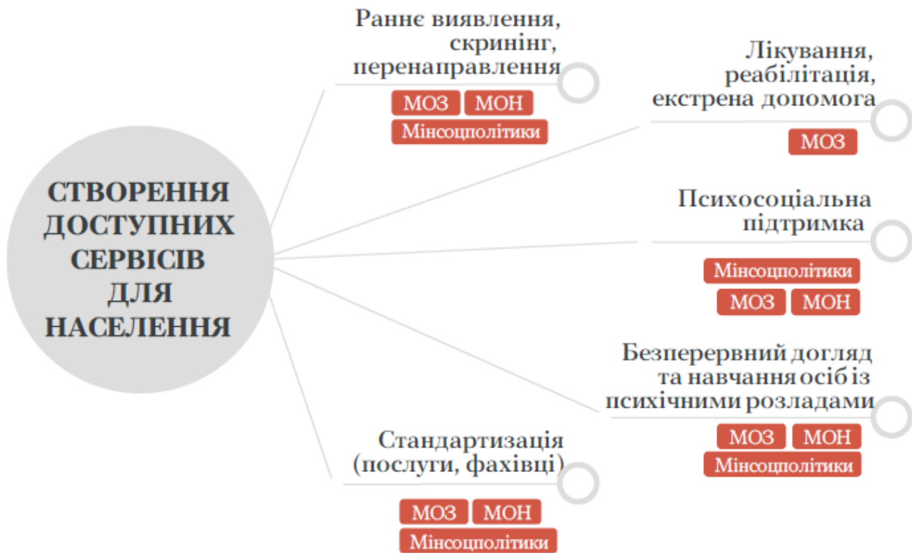
Рисунок 3. Створення доступних сервісів для населення.

2. Доступні послуги для населення – це можливість своєчасно отримати кваліфіковану допомогу, у тому числі безкоштовну, анонімну, перенаправлення та, як мінімум, не допустити погіршення стану. Наприклад, раннє виявлення, підтримка та перенаправлення, скринінг та раннє втручання, безбар'єрне та доступне лікування, орієнтування втручань на одужання та реабілітацію, інші послуги, які базуються на емпірично-обґрунтованих сучасних підходах і моделі комплексних біопсихосоціальних втручань (рис. 3).