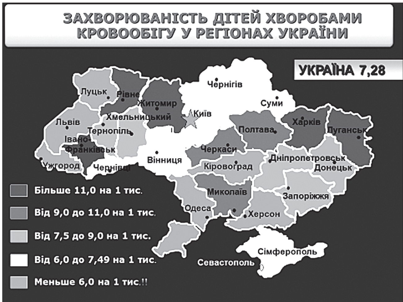
Рисунок 1. Захворюваність дітей хворобами кровообігу у регіонах України

В усіх областях з територіями радіоекологічного контролю відзначається висока захворюваність дитячого населення на хвороби системи кровообігу, що за винятком показників Волинської, Чернігівської, Київської та Сумської областей, переважає відповідні показники у областях із високими рівнями захворюваності дитячого населення, що не мають територій радіоекологічного контролю (таб. 2).