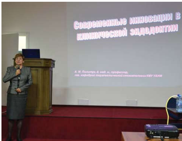
Фото 10. Президент Української ендодонтичної асоціації професор А.М. Політун читає лекцію «Інновації в клінічній ендодонтії».

За видатні заслуги в галузі підготовки стоматологічних кадрів, післядипломної освіти, багаторічну професійну діяльність і впровадження у практику стоматології новітніх досягнень науки й технологій професор А.М. Політун нагороджена медаллю «Ветеран праці» та професійними відзнаками: орденом «Золотий стаміл»