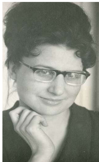
Фото 4. Кандидат медичних наук, асистент (1968 р.).