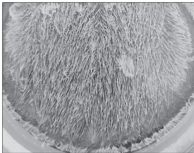
Рисунок 1. Загальний вигляд кристалограми базальної слізної рідини здорової людини

Так, кристалограма базисної слізної рідини здорових осіб (рис. 1) представлена у вигляді кристалографічного рисунка, який формується на кристалогра-