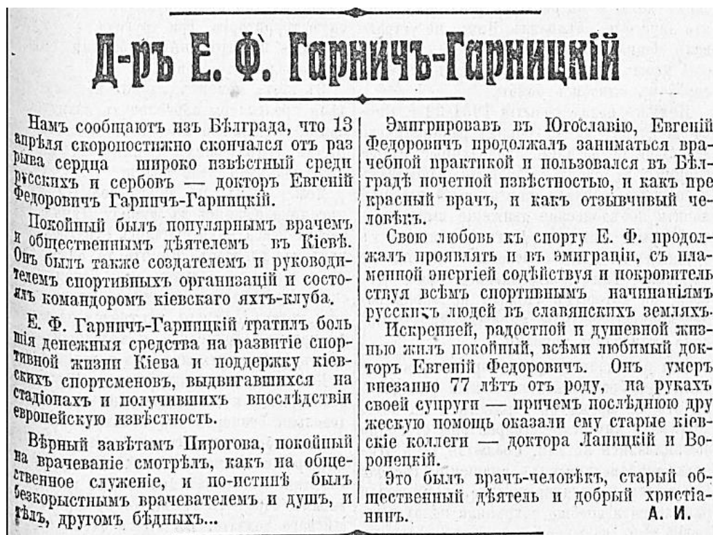
Фото 7. Некролог лікарю Є.Ф.Гарнич-Гарницькому.

15 травня 1936 року в газеті «Возрождение», що видавалась у Парижі російськими емігрантами, всесвітньовідомий письменник Олександр Купрін, який на той час був в еміграції, написав некролог Є.Ф.Гарнич-Гарницькому. До речі, нами встановлено, що саме Купрін підписав некролог цими загадковими ініціалами « А.И.», чим засвідчив вдячну пам'ять про свого вчителя і друга.