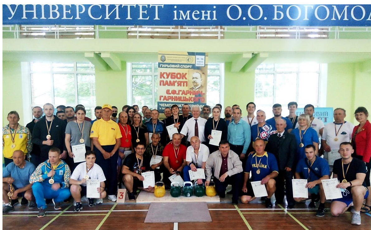
Фото 8. Учасники 6-го відкритого Кубка з гирьового спорту (спортсмени, тренери, судді), присвяченого пам'яті Є.Ф.Гарнич-Гарницького.

Таким чином, титанічна постать лікаря Є.Ф.Гарнич-Гарницького є прикладом безкорисного служіння людям, закликом до високої якості життя через заняття фізичною культурою і спортом.