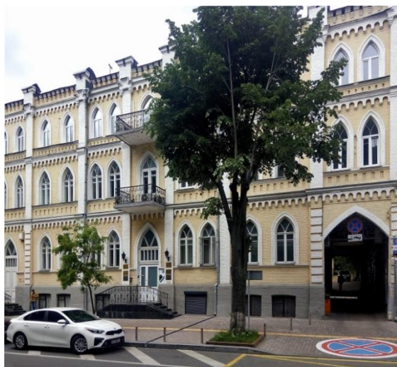
Фото 2. Будинок Ф.М.Гарнич-Гарницького,

Його батько Федір Минович був спадковим дворянином, який викладав у Харківському імператорському університеті, а потім переїхав до Києва і довгий час працював на посаді професора кафедри хімії Київського імператорського університету святого Володимира (1870-1891).