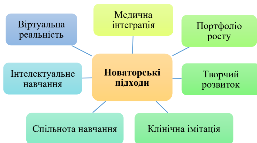
Рис. 1 Новаторські підходи у викладанні медичних дисциплін

Задля того, щоб організація дистанційного навчання була результативною, пропонуємо дослідити новаторські підходи у викладанні медичних дисциплін, які є важливою частиною адаптації медичної освіти до сучасних вимог охорони здоров'я нації. До них треба віднести віртуальну реальність, медичну інтеграцію, портфоліо росту, творчий розвиток, клінічну імітацію, спільноту навчання та інтелектуальне навчання. Розглянемо кожний з підходів та окреслимо їх теоретичний характер та практичну цінність використання в освітньому процесі медичного навчання.