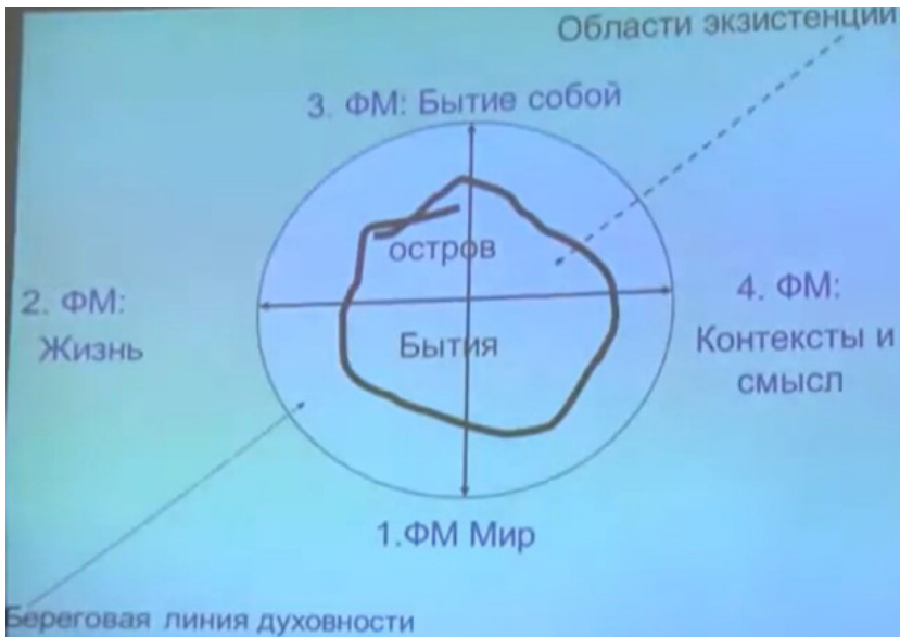
Фото: Духовність і екзистенція (доповідь А. Ленгле) [1].