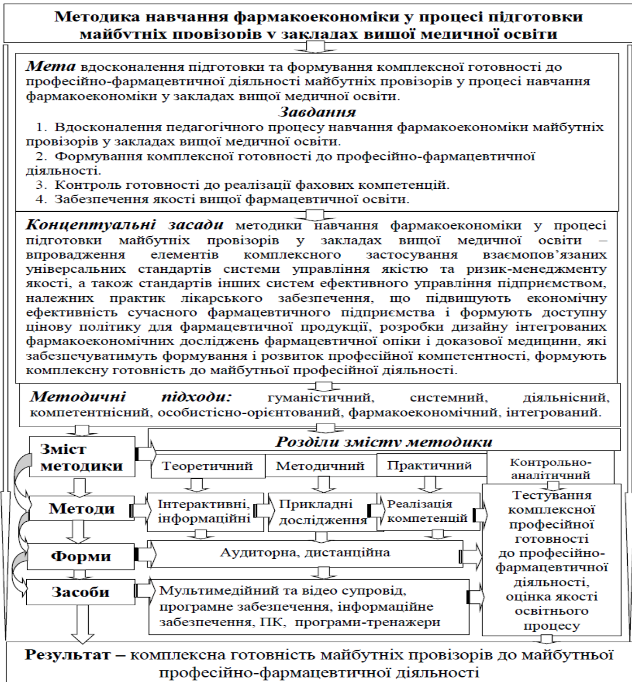
Рис. 1. Змістово-структурна модель методики навчання фармакоеконіки у процесі підготовки майбутніх провізорів у закладах вищої медичної освіти

сутність застосування фармакоеконічного аналізу доцільності застосування лікарських засобів як фармакоеконічної категорії.