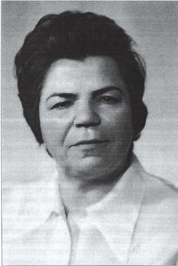
Фото 5. Олександра Семенівна Сокол

риства інфекціоністів України, чим сприяла підвищенню професійного рівня лікарів та становленню інфекційної служби в країні. У 1983 році їй було присвоєно звання Заслуженого діяча науки УРСР.