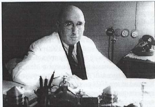
Фото 2. Макс Мойсейович Губергриц

Першими співробітниками кафедри 28 грудня 1925 року були призначені: старшим асистентом — Б.Я. Падалка, молодшими асистентами — О.П. Матвеев та Г.І. Хоменко. Головною клінічною базою кафедри на довгі роки стало відділення для інфекційних хвороб на території Олександрівської лікарні (яка стала іменуватися тоді лікарнею імені Жовтневої революції), побудоване в 1901 році. Лекційний курс на новій кафедрі розпочався 26 січня 1926 року, практичні заняття — в квітні цього ж року. Уже з 1928 року на кафедрі почав успішно працювати студентський науковий гурток.